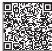
直播带货全流程 思维导图